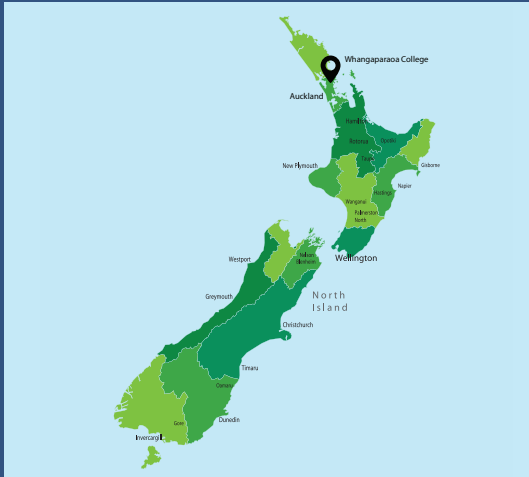
8 Stanmore Bay Rd, Stanmore Bay, Whangaparaoa

Trường Trung học Whangaparaoa nằm trên bán đảo cùng tên, phía Bắc của Auckland - thành phố lớn nhất của New Zealand. Đây là một vùng rất thích hợp và hấp dẫn cho việc học tập và sinh sống. Với các cảnh quan vô cùng tuyệt vời, cùng với các bãi biển đẹp như tranh vẽ nối tiếp nhau quanh bán đảo, cách thành phố nhộn nhịp chỉ 30 phút lái xe. Đồng thời với những cơ hội học tập và trải nghiệm tốt nhất, chúng tôi cam kết cho con em của quý vị tiếp cận với các sinh hoạt xã hội và các hoạt động ngoài trời đa dạng khi con em của quý vị theo học tại đây.